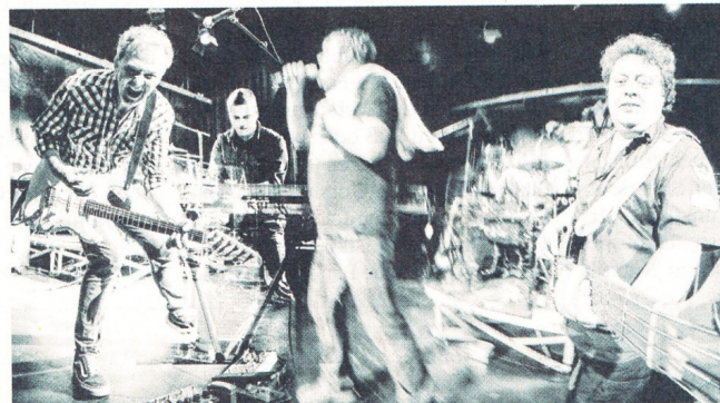
Superkerle setzen auf deutsche Texte – witzig, ironisch, provokant.

Augenzwinkern – und aus dem Leben gegriffen. Die Band besteht in dieser Formation seit 2011 aus fünf gut eingespielten Musikern, einige mit langjähriger internationaler Studio-